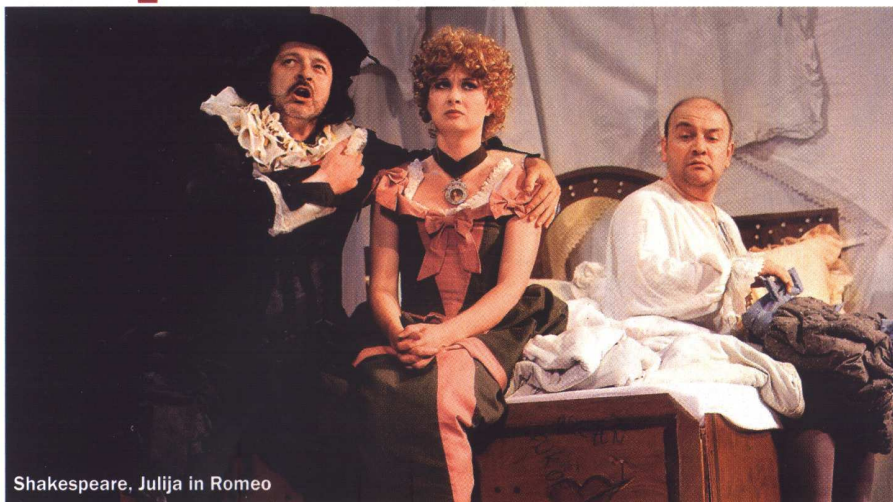
Shakespeare, Julija in Romeo