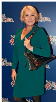
Salome je bila videti vrhunsko in se je tudi imenično zabavala.